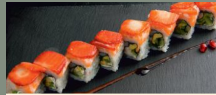
Fraise Fever 8.50€ (2,4,7) Dessus: saumon, fraise A l'intérieur: scampis cheese, concombre