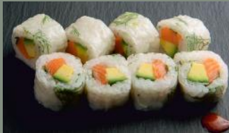
Saumon avocat 6.80€ (4) Aneth, menthe