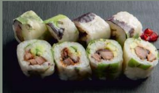
Pekin duck 6.80€ (2) Concombre, poireau, canard, sauce fruits de mer