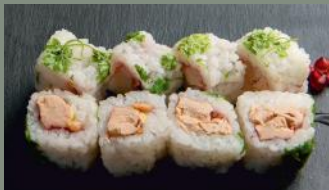
Foie gras 8.50€ Pignon, confiture cerise, certeuil