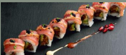
Tuna poisson 11,80€ (4,6,11) 🌶️ Dessus: thon, ciboulette, œufs de lompe A l'intérieur: thon, avocat, tobiko Sauce: teriyaki, chili