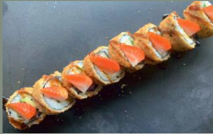
Saumon Love 13.00€ (1,4,7,11) Saumon, concombre avocat, cheese, fraise