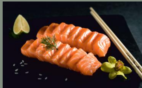
Saumon (4,11) 16 pièces 19.50€ 8 pièces 10.80€