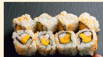
Scampis mango 7.20€ (2,3,4) Masago