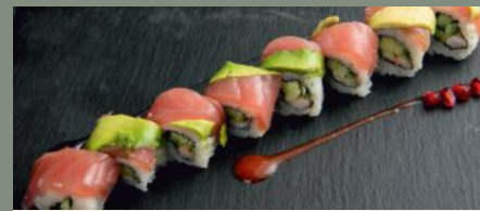
Tai zi 11.50€ (2,3,4) 🌶️ Dessus: thon, avocat A l'intérieur: scampis, concombre Sauce: spicy