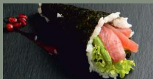
Thon avocat (4) 7.00€