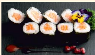
Saumon cheese 5.50€ (4)