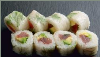
Thon avocat 7.00€ (4) Aneth, menthe