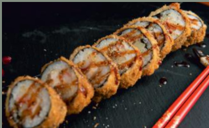
Poulet Spicy 11.80€ (1,3,4,11) Surimi, ananas