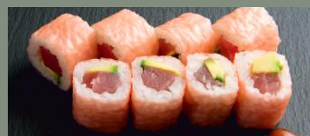
Thon avocat 6.80€ (4,6)