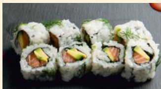
Saumon avocat 6.30€ (4) Aneth, ciboulette, huile d'olive