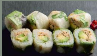
Thon cuit 6.50€ (4) Avocat, menthe, Ciboulette, mayo, piment