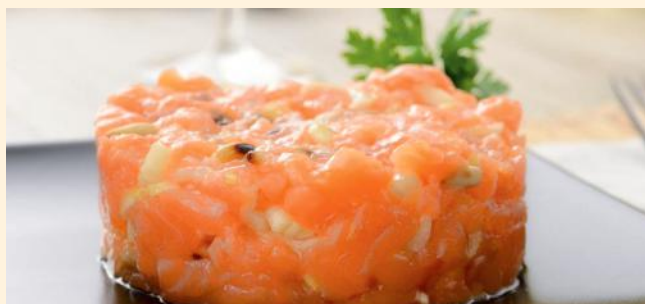
Tartare de Saumon (4,11) 15.80€ Mangue, avocat, oignons fins, sauce Japonaise