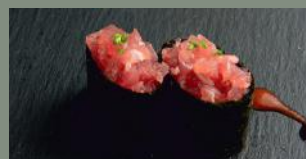
Tartare de thon (4) 6.50€