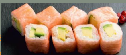
Avocal cheese 5.50€ (6,7)