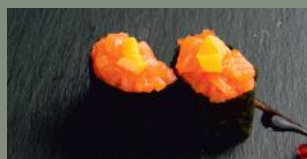
Tartare de saumon +truffe (4) 7.00€