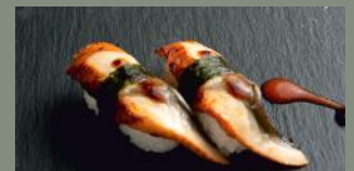
Anguille (4) 6.00€