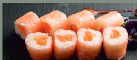
Saumon cheese 6.50€ (4,6,7)