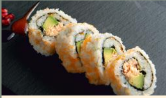
Big roll crabe 7.00€ (2,3,4) Chair de crabe, masago, avocat