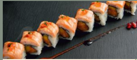
Crazy Saumon roll 10.50€ (1,4,6) 🌶️ Dessus: saumon, oeufs de saumon A l'intérieur: saumon, mangue Sauce: teriyaki, chili