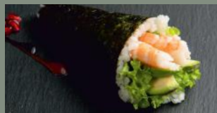
Scampis avocat (4) 7.00€