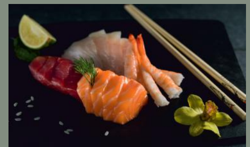
Assortiment (4,11) 20 pièces 25.80€