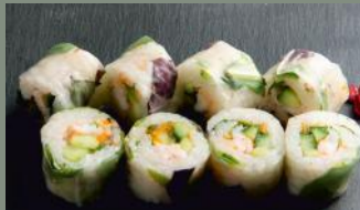
Scampis concombre 7.00€ (4) Masago, mache