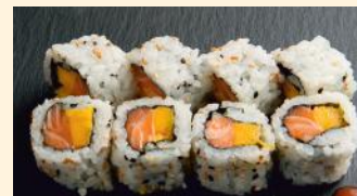
Saumon mango 6.30€ (4, 11)