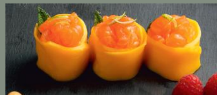
Flower mangue 8.00€ (4)