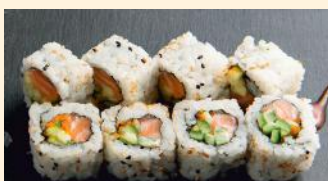
Dynamite 7.20€ (3,4, 11) Saumon, masago, concombre, sauce spicy