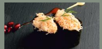
Chair de crabe (2,3,10) 6.00€