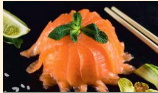
Saumon avocat 19.50€ (4,11)