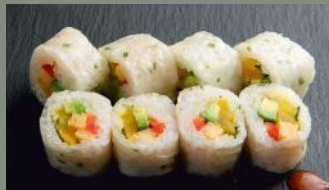
Végétarien 6,80€ (3) Omelette, radis japonais, avocat, menthe