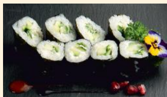
Concombre cheese 4.80€ (7)