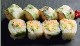
Chair de crabe 6.80€ (2,3,10) Avocat, menthe, salade