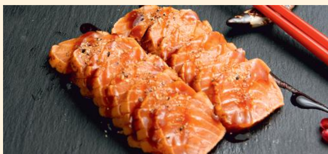
Saumon (3,4,10) 16 pièces 22.50€ 8 pièces 12.80€