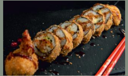
Scampis délice 14.20€ (1,2,3,11) Tempura scampi, avocat, mangue, sauce spicy