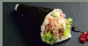
Tartare de thon 7.50€ (4)