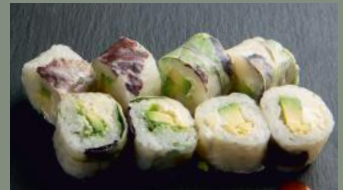
Avocat cheese 5.80€ (1)