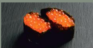
Oeufs de saumon (4) 7.00€