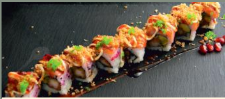
Volcan Roll 10.50€ (1,3,4,6) 🌶️ Dessus: saumon, masago wasabi A l'intérieur: Tempura daurade, avocat, lolo vert Sauce: teriyaki, spicy