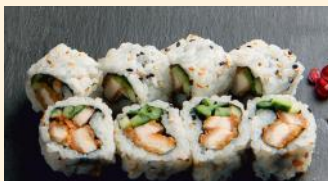
Chicken basilic 6.50€ (1,11) Concombre, sauce spicy