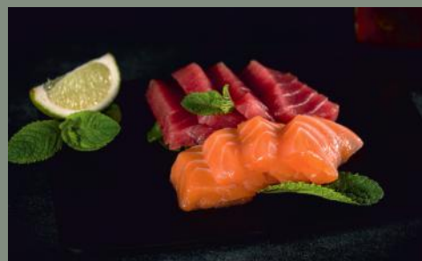
Saumon thon (4,11) 16 pièces 22.80€ 8 pièces 11.90€