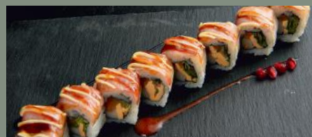
Rome Roll 9.80€ (1,3,4,7,10,11) Dessus: jambon, mayo A l'intérieur: roquette, tomate, lolo vert, cheddar, surimi Sauce: sésame