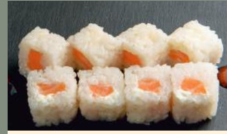
Saumon cheese 5.80€ (4,7)