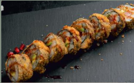
Thon 14.20€ (1,3,4,10,11) 🌶️ Thon, tobiko orange, mayo Japonaise, piment