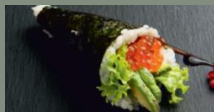
Oeufs de saumon (4,11) 7.20€