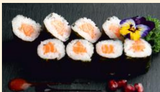
Saumon 5.20€ (4)