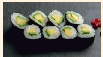
Avocat cheese 5.00€ (7)