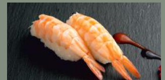
Scampis (2) 5.50€