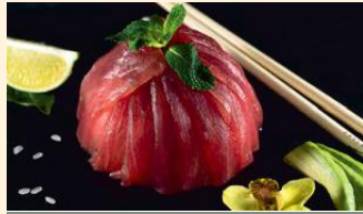
Thon avocat 21.00€ (4,11)