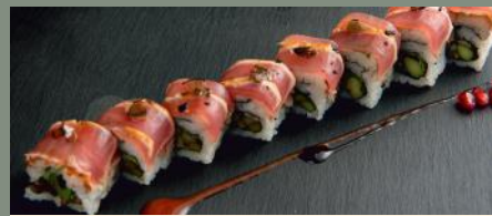
Tataki thon aux truffes 12.50€ Dessus: thon mi-cuit truffes A l'intérieur: roquette, asperge vert, shimeji Sauce: sésame(1,4,11)