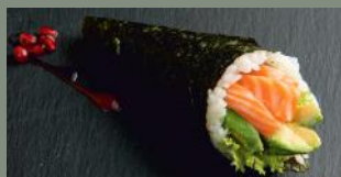
Saumon avocat (4) 6.20€