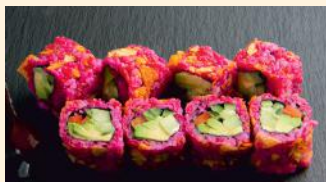
Pink veggie 6.00€ (3,4,10) Concombre, avocat, mayo, poivron