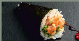
Tartare de saumon 7.20€ (4)