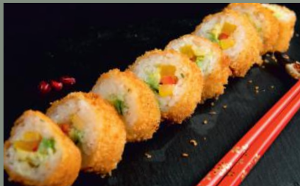
Végétarien 10.00€ (1,3) Omelette, poivron, radis, avocat, menthe