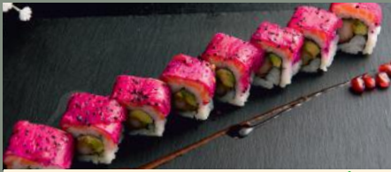
Crazy Lobster 14.00€ (1,2,3,4) 🌶️ Dessus: saumon, pitaya A l'intérieur: Tempura homard, avocat Sauce: spicy