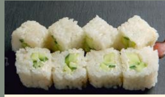
Concombre Cheese 4.80€ (7)