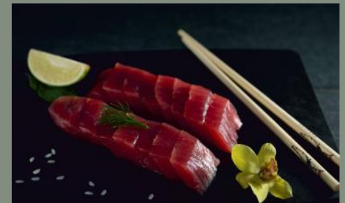
Thon (4,11) 16 pièces 23.50€ 8 pièces 13.80€