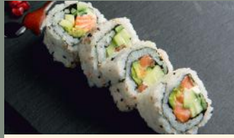
Big roll saumon 6.50€ (4,7,11) Saumon, cheese, avocat, concombre, sésame