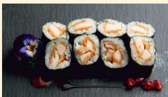
Poulet curry 5.50€ (1) Avec lait de coco