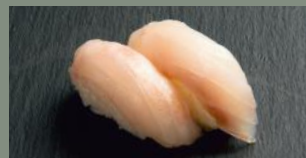
Daurade (4) 5.50€