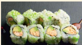
Chair de crabe 6.80€ (2,3,4,10) Masago, avocat