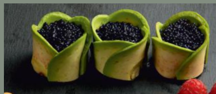
Œufs de lompe 8.00€ (4)