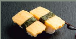
Omelette (3) 4.20€