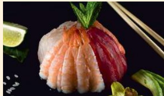
Assortiment 21.50€ (2,4,11) Saumon, thon, scampis, daurade, avocat