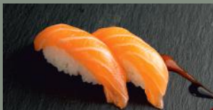
Saumon (4) 4.80€