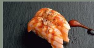
Saumon mi-cuit (4,11) sauce barbecue 5.20€