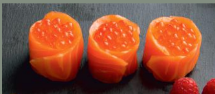
Œufs de saumon 8.80€ (4)