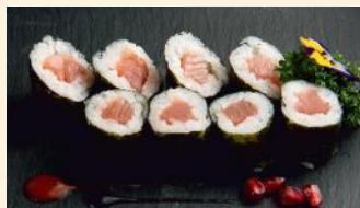
Thon 5.80€ (4)