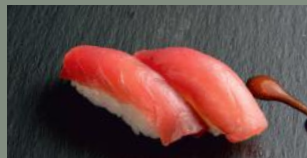
Thon (4) 5.50€