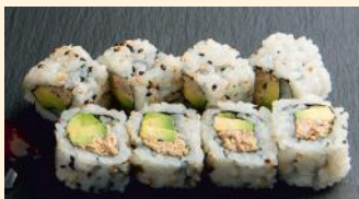
Thon cuit avocat 6.50€ (3,4,10,11) Thon cuit, menthe, ciboulette, mayo, sauce spicy