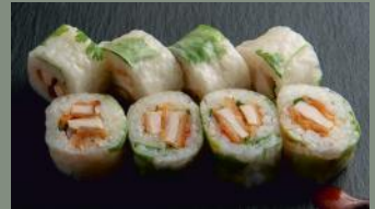
Poulet fermier thai 6.80€ (1) Sauce thaï, menthe, piment