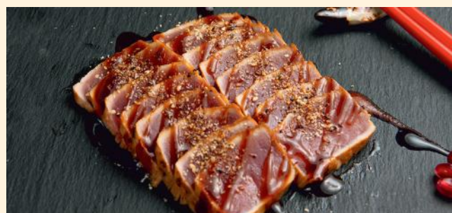
Thon (3,4,10) 16 pièces 26.50€ 8 pièces 14.80€