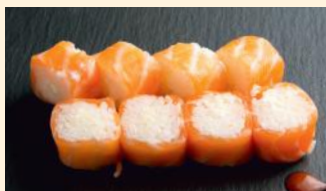
Saumon roll 7.00€ (2,7) Saumon, cheese