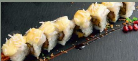
SNS ROLL 12.80€ (1,2,3,4, 8, 10,14) 🌶️ Dessus: coquille St-Jacques, mayo japonais A l'intérieur: Tempura aux scampis, avocat, mangue Sauce: spicy