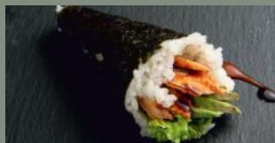
Anguille avocat 7.00€ (4)