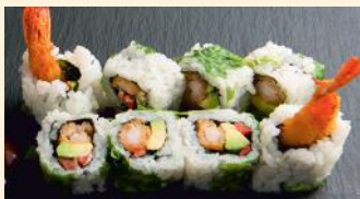
Scampis tempura 7.50€ (1,2,3) Scampis, avocat, coriandre