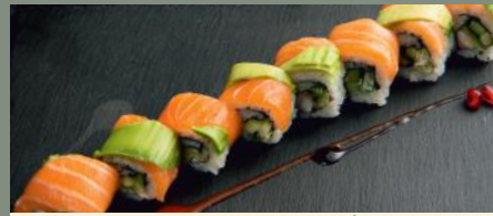
Gong zhu 8.00€ (2,3,4) 🌶️ Dessus: saumon, avocat A l'intérieur: scampis, concombre Sauce: spicy