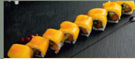
Guo wang 8.00€ (3,4) 🌶️ Dessus: mangue A l'intérieur: saumon, concombre Sauce: spicy