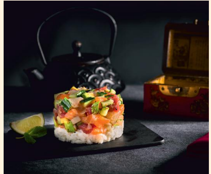
Mariné 19.50€ (4,11) Saumon, thon, daurade, coriandre, concombre, poireau, mangue, avocat, sauce spicy