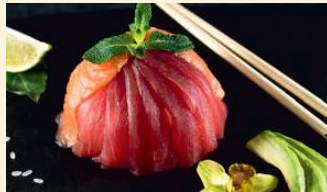
Saumon thon avocat 20.50€ (4,11)